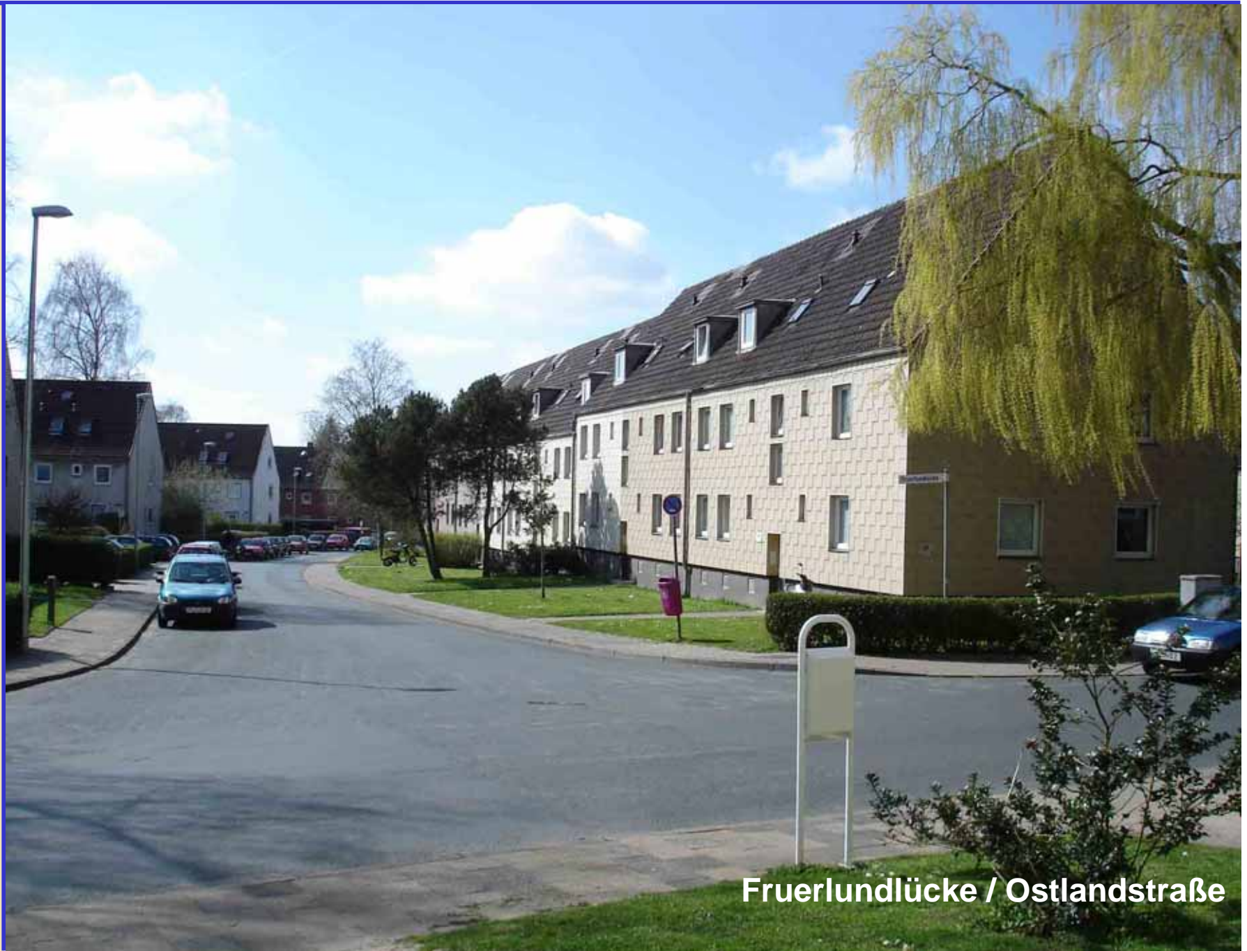
Frerlundlücke / Ostlandstraße