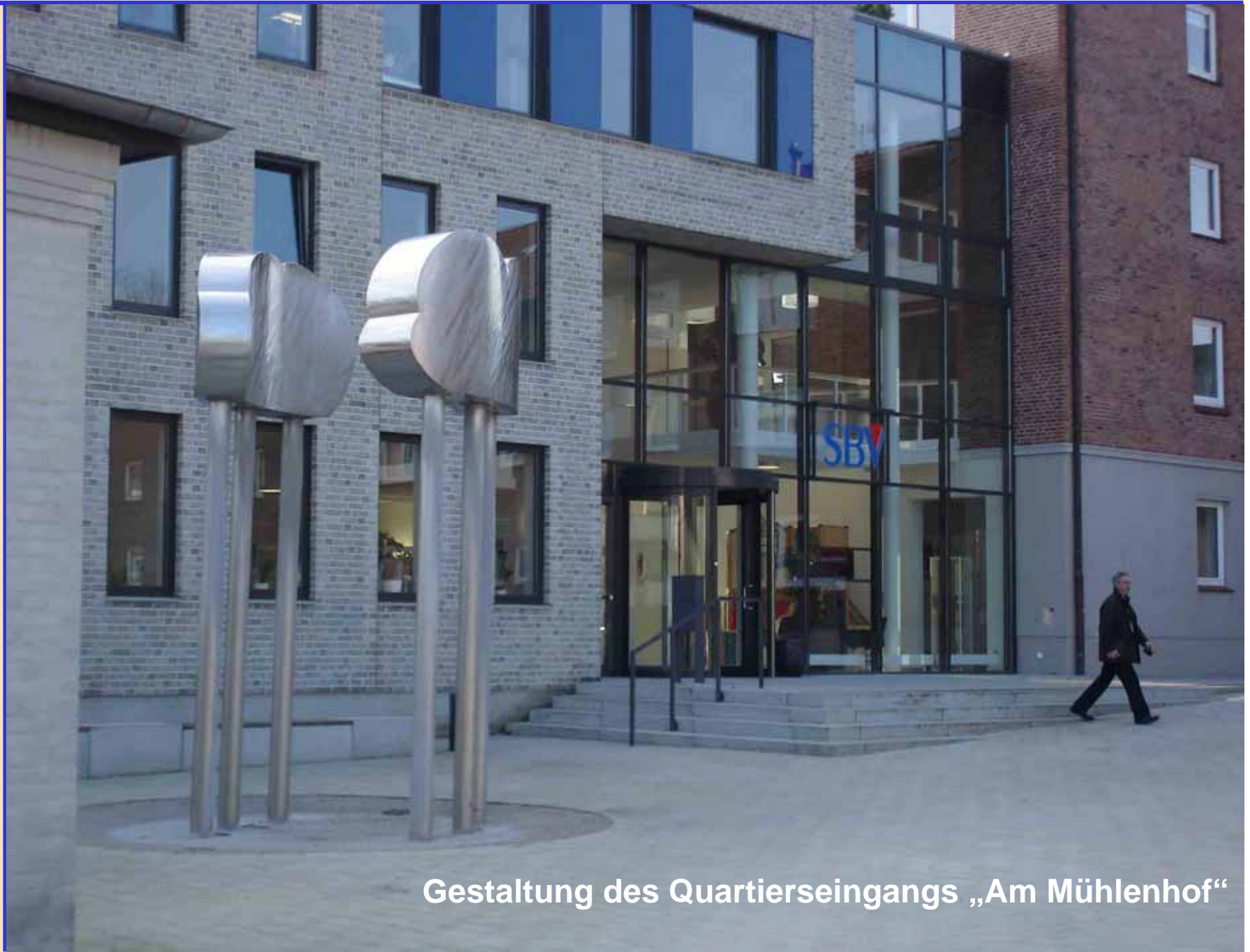
Gestaltung des Quartierseingangs „Am Møhlenhof“